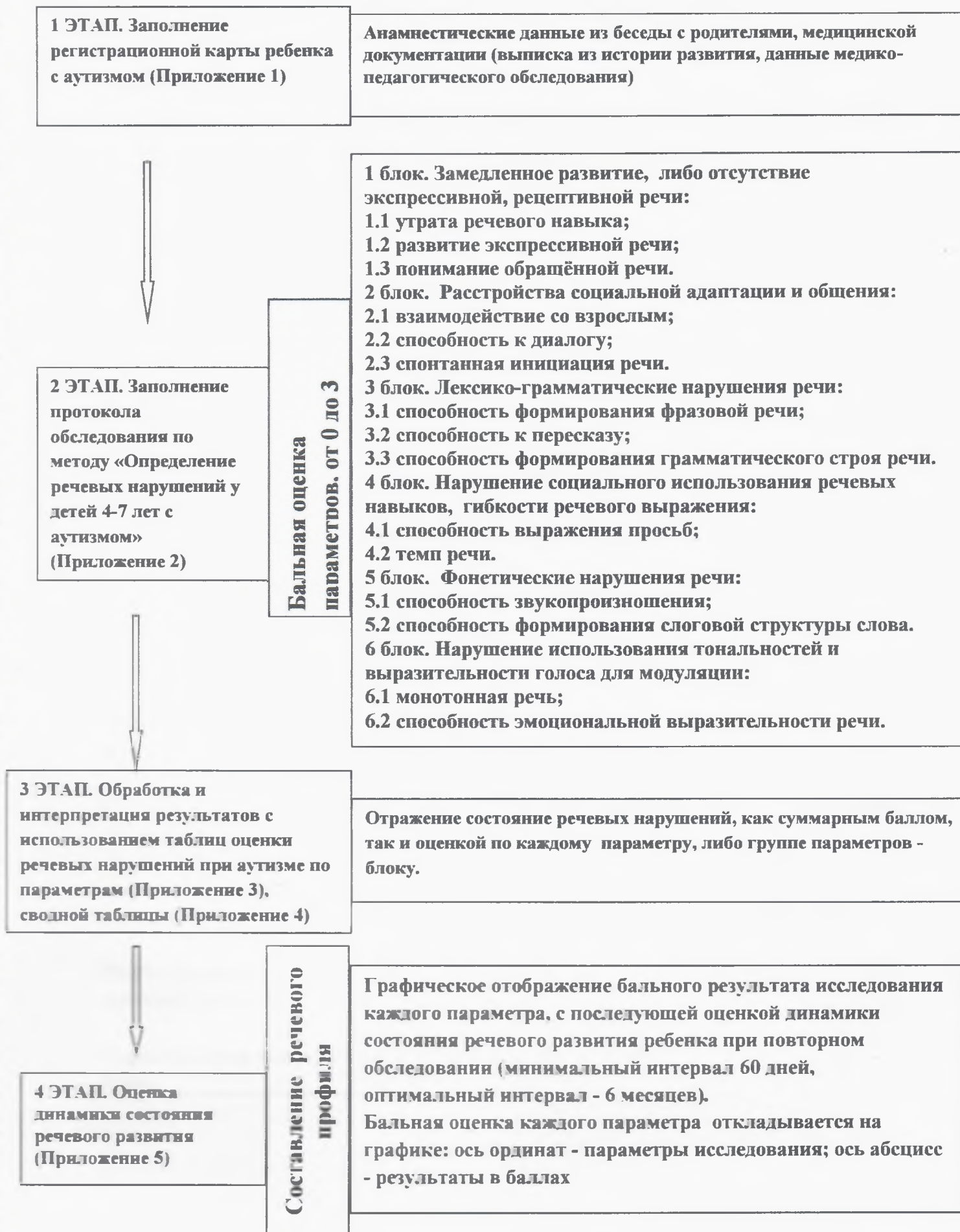
Схема процедуры обследования